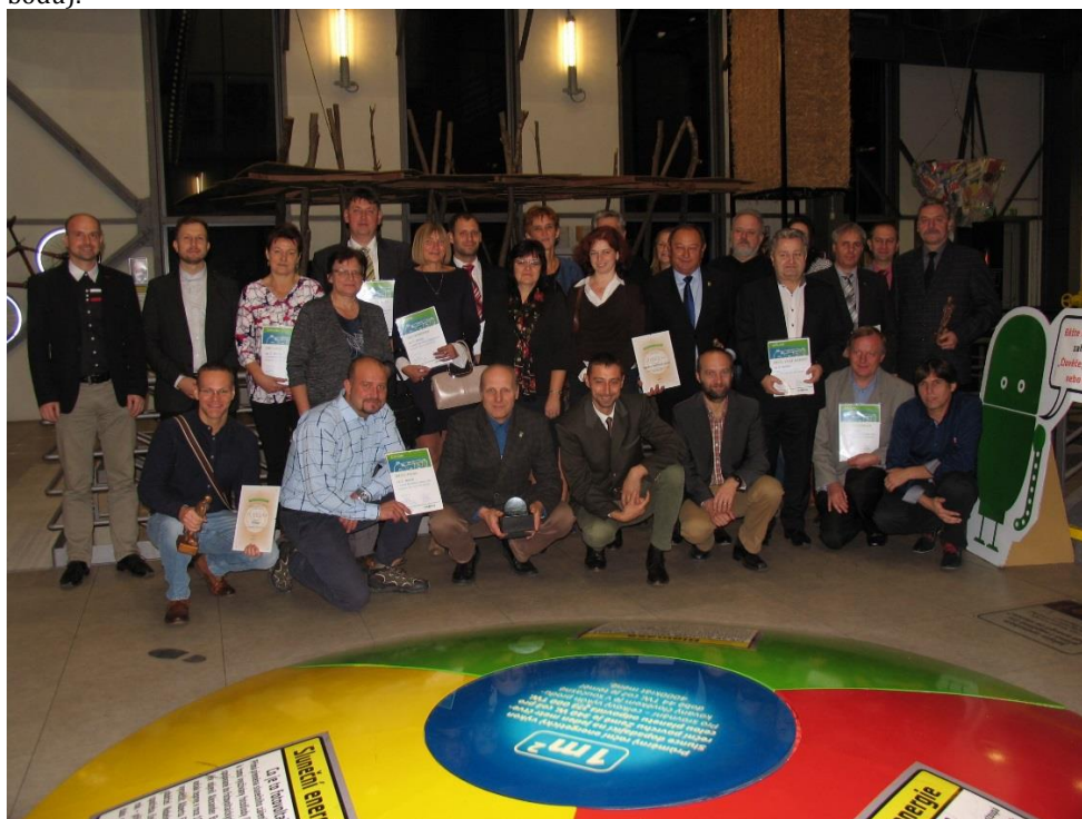
Vyhlášení soutěže „My třídíme nejlépe“