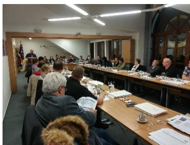
Členská schůze Mikroregionu Novoměstsko | foto: Ina. Lenka Slámová

Dne 6. 12. 2018 se uskutečnilo 6. oficiální setkání představitelů obcí Mikroregionu Novoměstsko v rámci projektu Centra společných služeb. Na setkání bylo přítomno 27 zástupců obcí z 30 obcí DSO. Na setkání byl mimo jiné schválen rozpočet mikroregionu na rok 2019. Celý zápis z jednání členské schůze je volně ke stažení na webových stránkách www.novomestsko.cz .