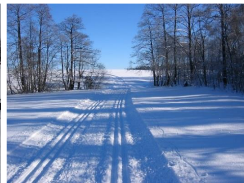
Úprava lyžařských turistických tratí